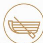
Paseo en bote