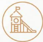
Área de juegos para niños