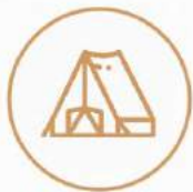
Zona de camping