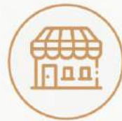
Minimarket y Tópico